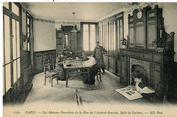
Ces salles de lecture favorisaient l'accès à la culture