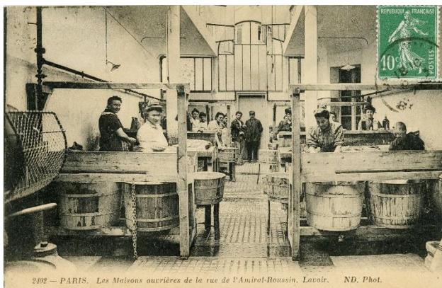
L'eau courante dans les logements n'existe pas encore.