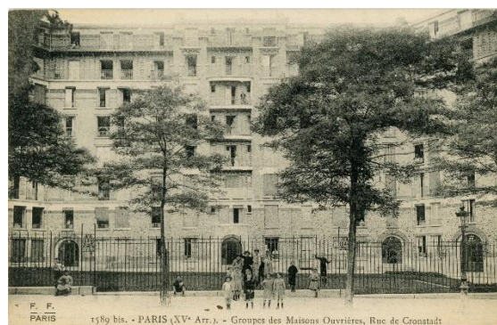
Rue de Cronstadt. Une horloge donne l'heure, car les pendules étaient onéreuses !