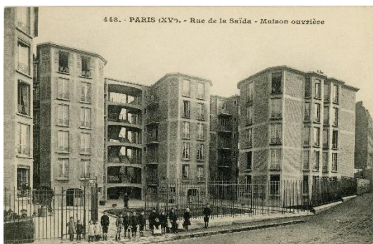
Rue de la Saïda