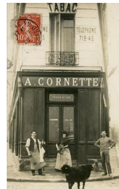
L'actuel café Le Dantzig