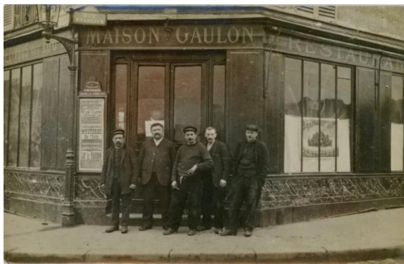
Le café Au Rendez-Vous des 100 kg était situé face à l'entrée du marché au chevaux