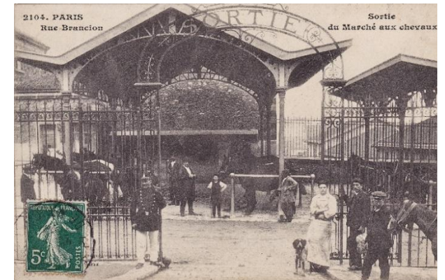
Les vendeurs s'appelaient « maquignons ».