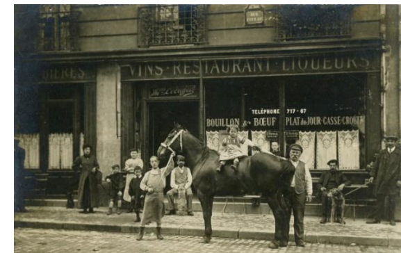
Le café restaurant L'Écuyer, Rue Fizeau