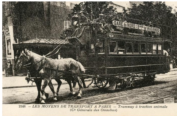
Exemple de transport hippomobile : la ligne 39