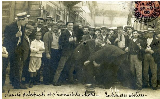
Usines Mors – Le personnel

Louis Mors est ingénieur de l'École centrale de Paris. Entre 1895 et 1925, avec son frère Émile, il conçoit et construit des voitures 46 rue du Théâtre. En 1898, l'industrie Mors construit 200 voitures par an. En 1906, Emile Mors s'associe à André Citroën qui double la production de la marque en 10 ans.