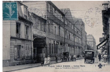
Usines Mors – La sortie au 46 rue du Théâtre

Les ateliers Mors, deviennent usines sous l'impulsion de Citroën. La vie du hameau de Javel s'identifie à celle d'une ville.