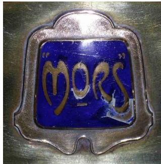
La marque Mors