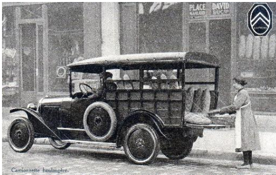
Carte postale éditée par Citroën

André Citroën est célèbre pour son rôle d'industriel. Il l'est tout autant pour avoir su « faire parler de la marque Citroën ».