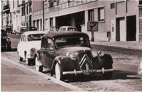
Les chevrons de la gloire

La Citroën 7, présentée à Paris en 1934, restera dans l'histoire sous le nom de Traction Avant . On ne peut la confondre avec aucun autre véhicule. Sa ligne et son fonctionnement séduisent le public immédiatement et on la verra partout.