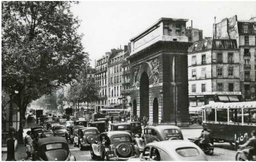
A la Porte Saint-Martin

La Citroën 7, présentée à Paris en 1934, restera dans l'histoire sous le nom de Traction Avant . On ne peut la confondre avec aucun autre véhicule. Sa ligne et son fonctionnement séduisent le public immédiatement et on la verra partout.