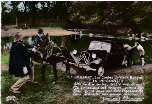
Tombée à l'eau : la Brenne et ses étangs