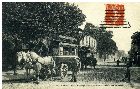
Place Violet et l'omnibus de la ligne 80 ou 70

La rue Violet est un espace paisible du XV ème arrondissement qui porte le nom d'un entrepreneur-constructeur : Jean-Léonard Violet (1791-1881). Ce dernier a participé à la création du village de Grenelle. Une école d'électromécanique, créée après l'Exposition Universelle de 1900, a porté plusieurs noms très sérieux, mais sera connue sous le nom d'Ecole Violet, alors que jamais cet « état civil » ne lui a été délivré. Elle donnera jusqu'en 1982 des milliers d'ingénieurs et techniciens.