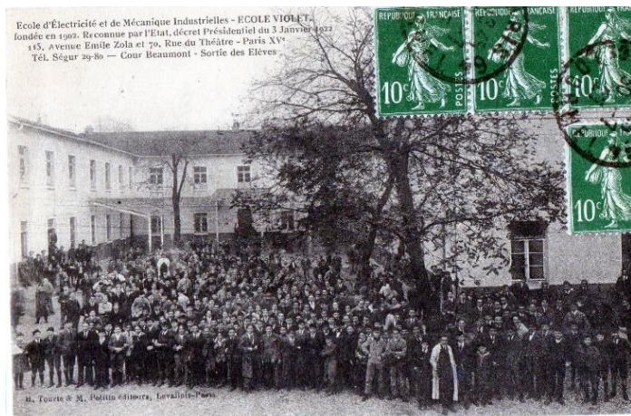
Ecole d'Électricité et de Mécanique Industrielles - ECOLE VIOLET, fondée en 1901. Reconnue par l'Etat, décret Présidentiel du 3 Janvier 1929 115, Avenue Emile Zola et 70, Rue du Théâtre - Paris XV e - Tél. Ségur 29-80 - Cour Beaumont - Sortie des Elèves H. Tourin et M. Petitin, éditeurs, Levallois-Paris

L'enseignement de l'École d'Électricité et de Mécanique Industrielle (EMI) est organisé par les industriels en fonction de leurs besoins spécifiques et pour suivre les innovations techniques.