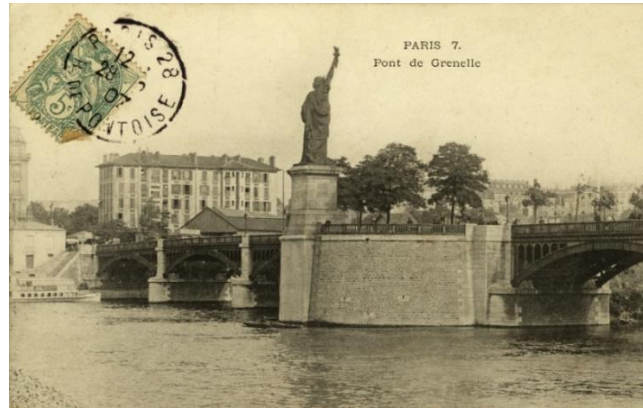
Aujourd'hui la « Liberté » est tournée vers l'aval de la Seine et fait face à Liberty Island

La statue de la Liberté éclairant le monde (œuvre d'Auguste Bartholdi, 1834-1904) a été offerte à Paris par la communauté américaine de Paris, en remerciement de celle offerte par le peuple français en 1886.