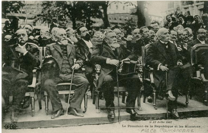
Le Président de la République Armand Fallières, en compagnie de Clémenceau, inaugure la statue de Giuseppe Garibaldi, place Cambronne