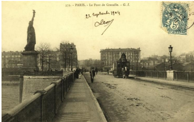
A l'origine, la statue de Bartholdi est tournée vers la Tour Eiffel