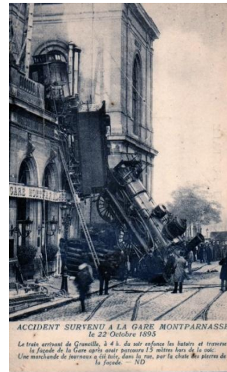
Une carte postale célèbre !