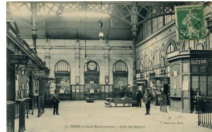
La première gare est construite en 1840, la seconde, plus vaste, en 1852. Les trains électriques y circuleront à partir de 1937. La Gare Montparnasse dessert en particulier la Bretagne et les Pays de Loire.