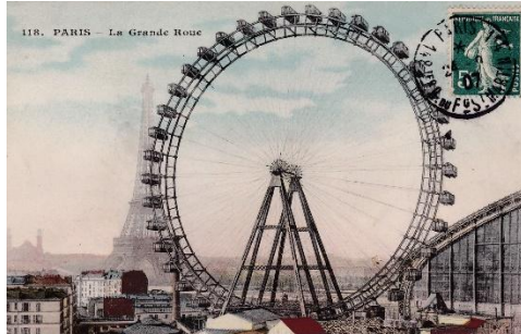
La Grande Roue