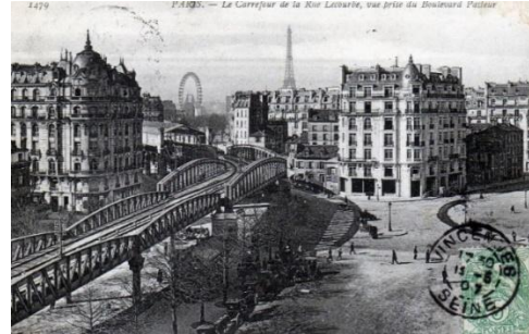
La Grande Roue vue du métro aérien

Durant l'Exposition universelle de 1900, le Village Suisse et la Grande Roue étaient situés entre l'avenue de Suffren et l'avenue de la Motte-Piquet. Les nacelles de la roue seront récupérées par les brocanteurs de l'époque. Ces derniers resteront au Village Suisse.