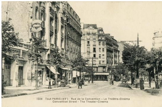
Le cinéma Gaumont au métro Convention vit une cure de jeunesse. Nous serons heureux de le retrouver bientôt.