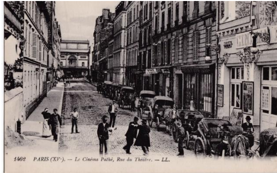
Le cinéma Pathé est sur la droite ; au fond le Palace (ex Théâtre de Grenelle).