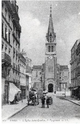
Le film La Mariée était en noir de F. Truffaut a été tourné à l'Eglise Saint-Lambert.