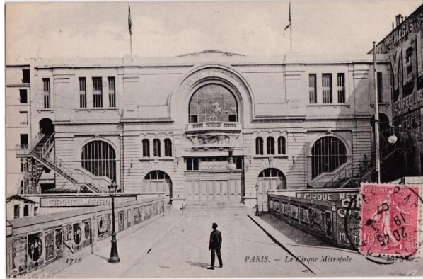
Le cirque Métropole, situé au 18-20 avenue de la Motte-Piquet, a ouvert après 1870. En 1907, il devient le Cirque de Paris. Il ferme définitivement dans les années 30.