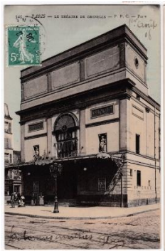
Le théâtre de Grenelle au 55 rue de la Croix-Nivert.