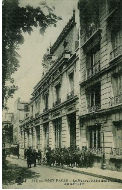
Hôtel des Postes