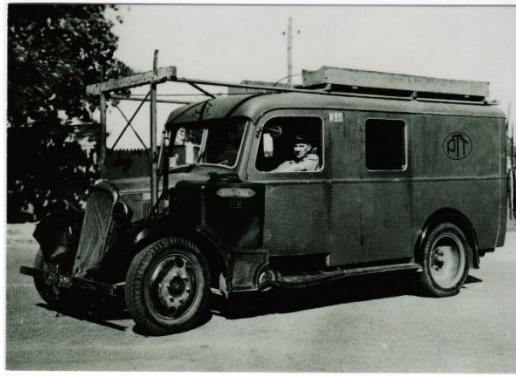
Le facteur dans un véhicule Citroën

C'est grâce aux employés des postes que les cartes postales pouvaient partir loin et arriver à bon port